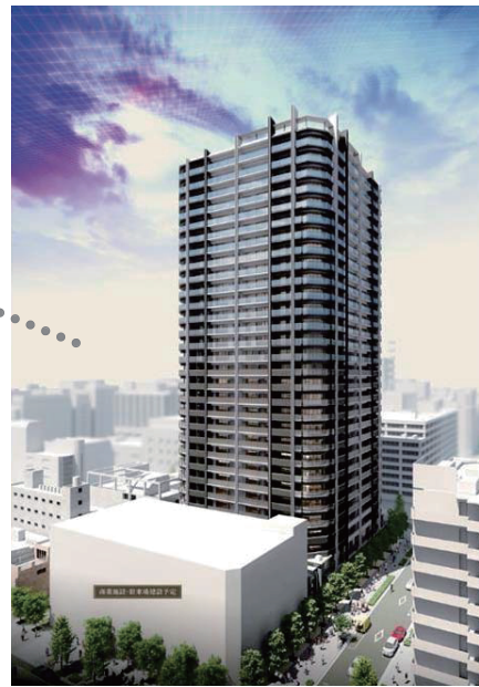
図1 錦二丁目7番地区再開発の鳥瞰パース